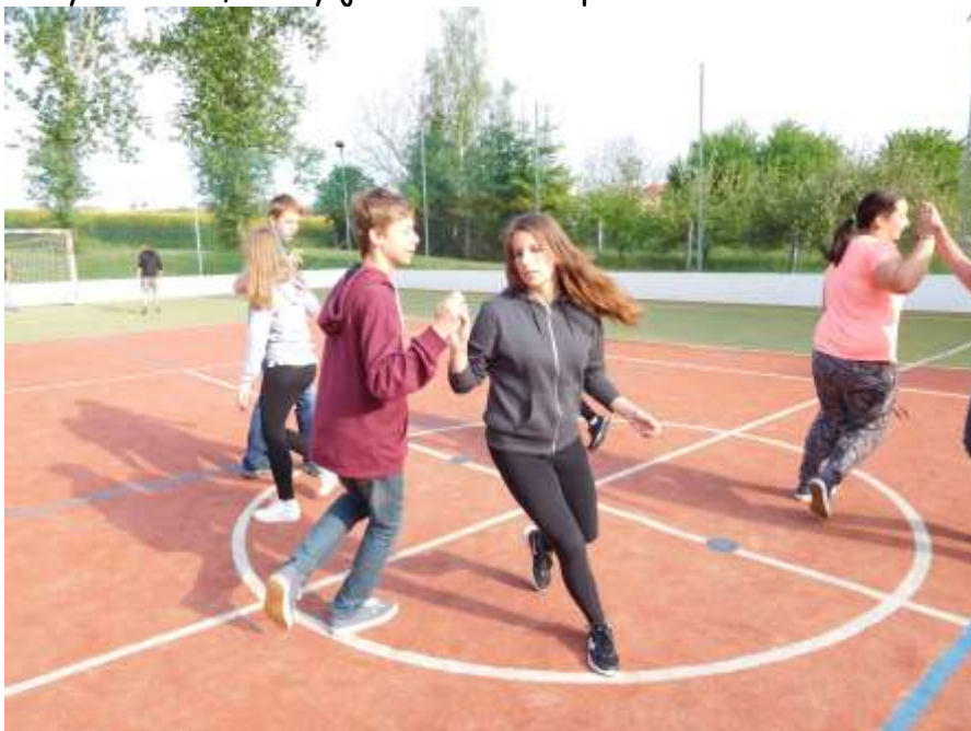
Příprava devátáků na vystoupení

V pátek 20. května se konaly již tradiční a oblíbené akce - Chotíkovská šlápota a jarmark. Akci zahájila na školním hřišti paní ředitelka. Pak vystoupil pěvecký sbor a devátáci předvedli své taneční vystoupení. A pak si všichni účastníci mohli zakoupit nějaké výrobky vytvořené žáky a vydat se na 3. ročník Šlápoty. Tentokrát jsme se ocitli v historii. Začali jsme v pravěku a na konci pětikilometrové trasy po okolí Chotíkova jsme se ocitli v budoucnosti. Za závěr - při splnění všech úkolů - jsme dostali na památku malý batůžek s logem školy a vuřtík, který jsme si mohli opéci.