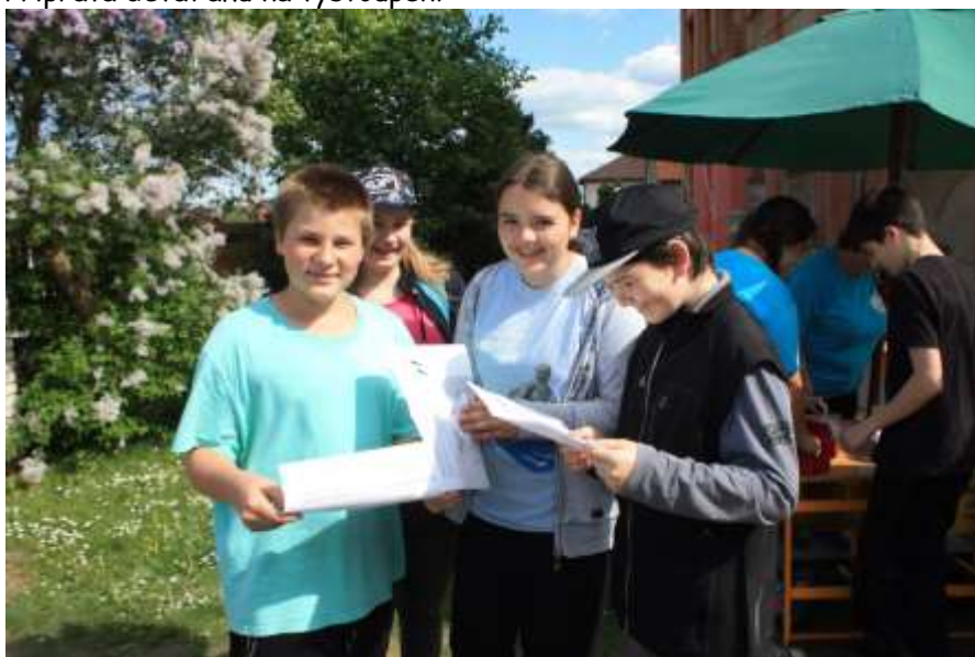
Šestáci se vydávají na trasu Šlápoty.