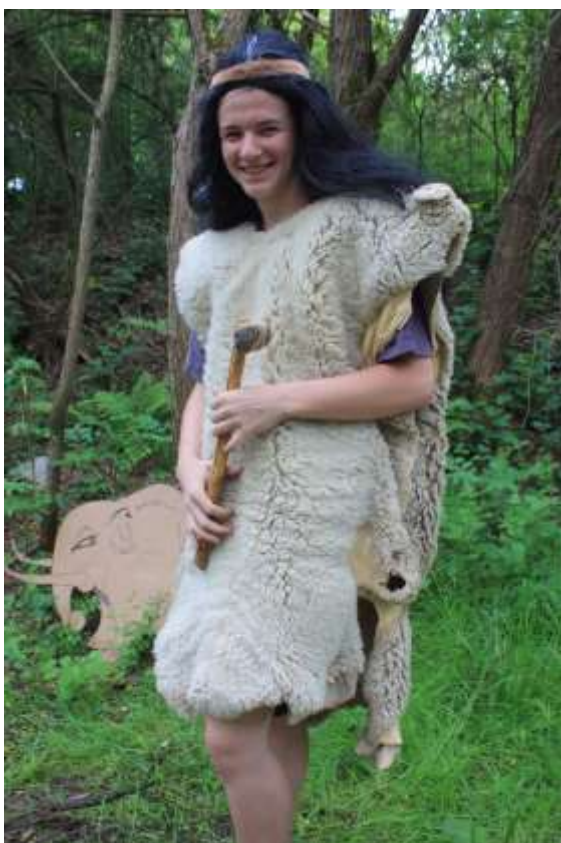
Hurá na mamuta!